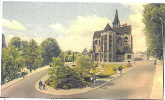
Image indicative