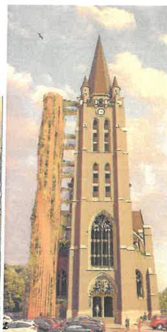
Image indicative